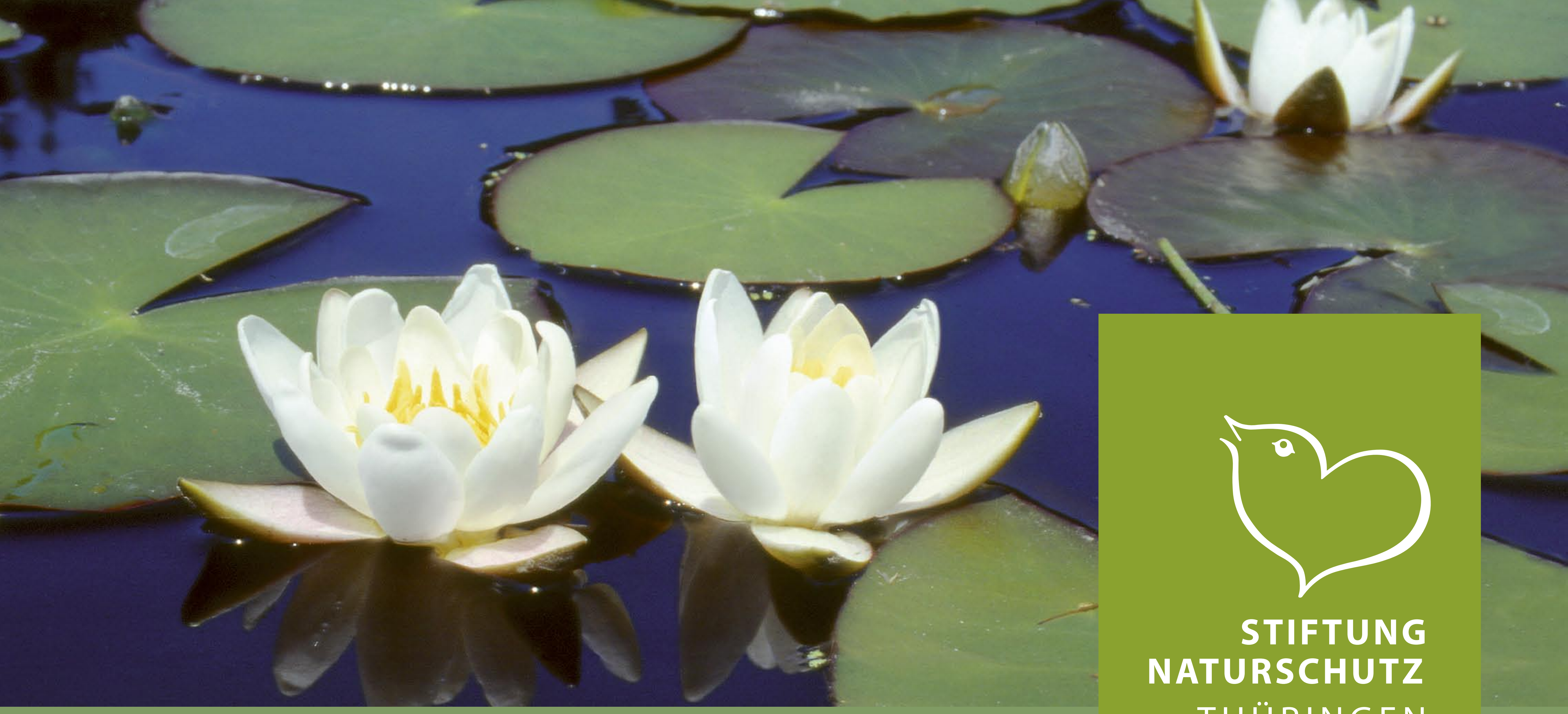
A Kleine Seerose

Thüringen ist eines der floristisch reichsten Gebiete Mitteleuropas und die Wurzeln floristischer Arbeiten lassen sich weit über 400 Jahre zurückverfolgen.